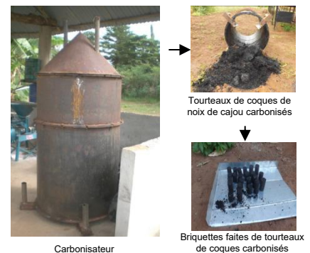
Fig 2: Dispositif de carbonisation des tourteaux de coques de noix cajou pour la fabrication de combustible non polluant

Les coques des noix cajou broyées ont permis l'extraction du baume de coques de cajou. Le séchage des coques améliore le taux d'extraction du baume mais allonge la durée de l'opération (Tableau 1). Les tourteaux des coques broyées a permis de fabriquer un charbon utilisable par les ménages.